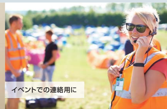
イベントでの連絡用に