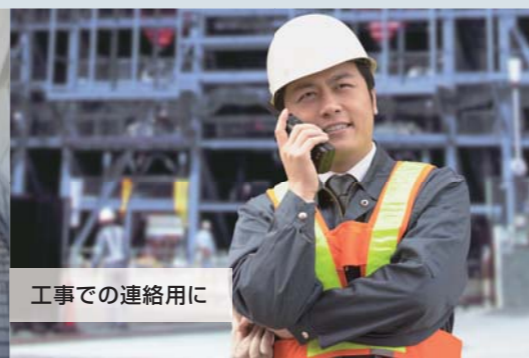
工事での連絡用に